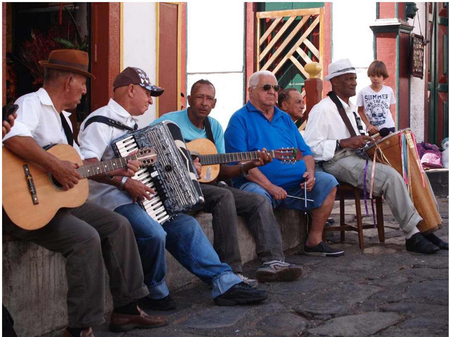
Diamantina, musiciens dans la rue