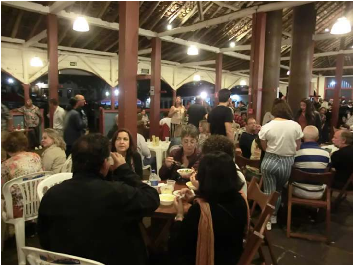
Diamantina, une soirée au vieux marché municipal