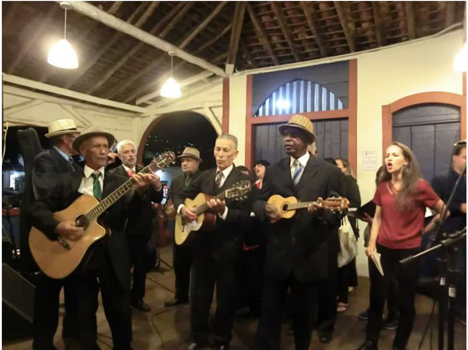
Diamantina, rodas de choro au vieux marché municipal