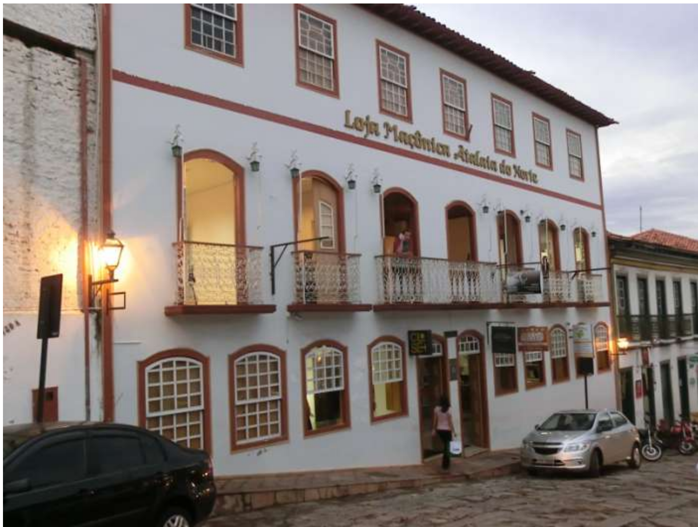
À Diamantina, la loge Atalaia do Norte se trouve sur la place de la cathédrale