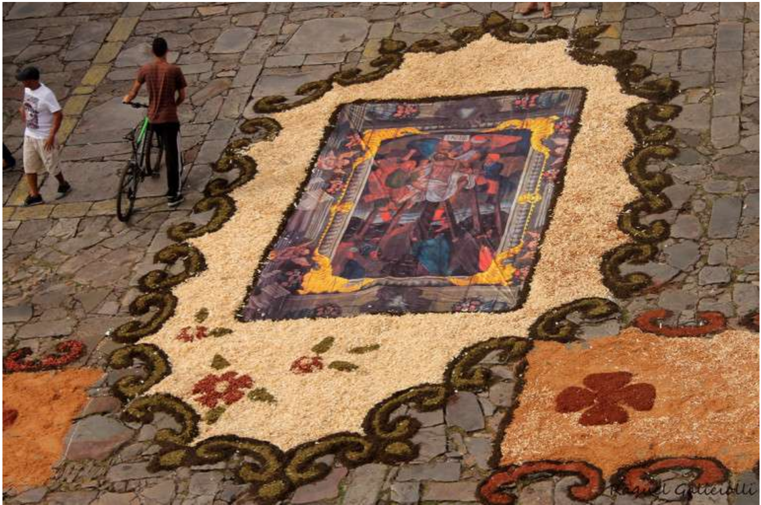
Tapisseries de Pâques en sables colorés et sciure de bois, devant la cathédrale de Diamantina