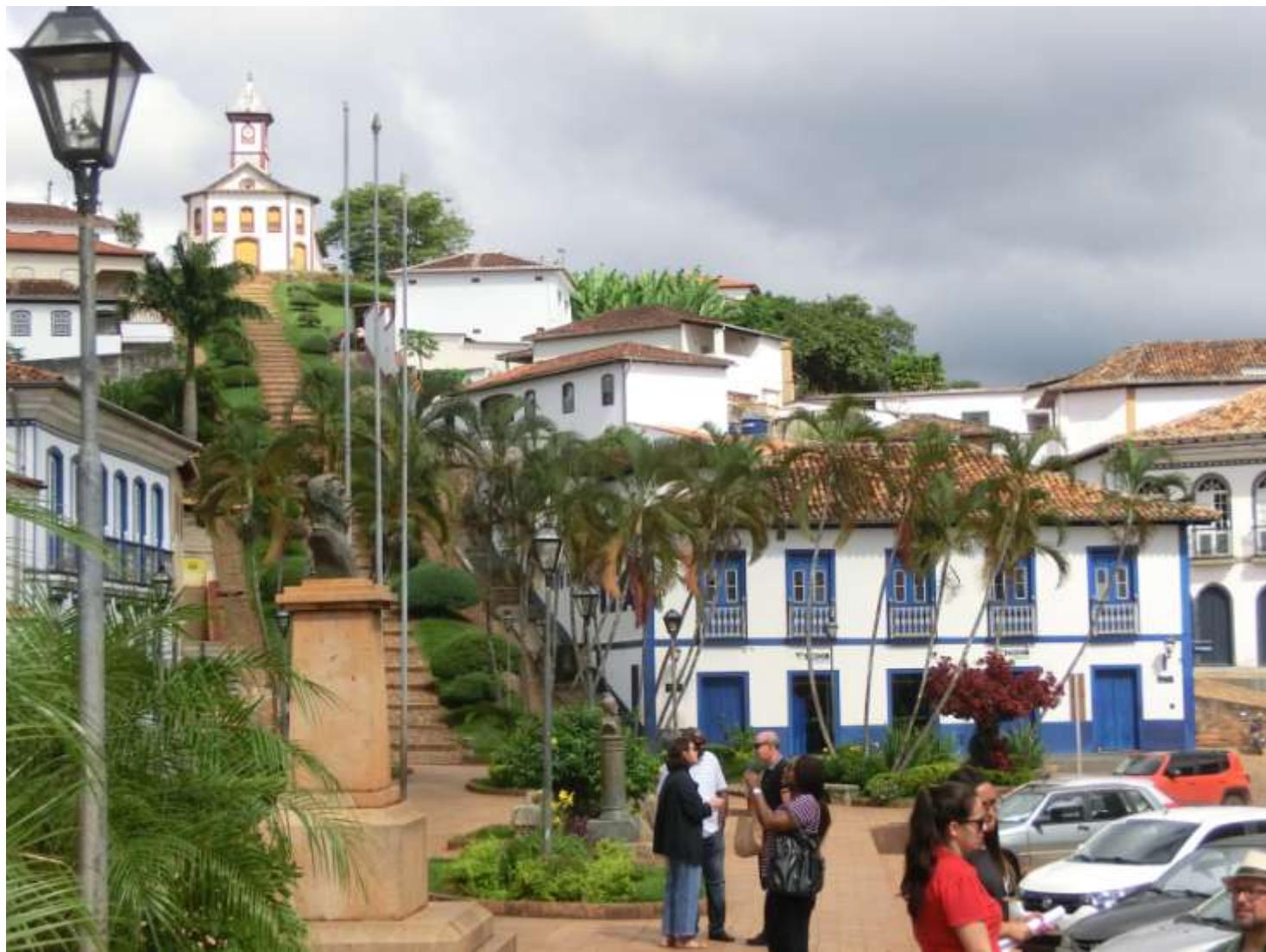
Serro, autrefois Vila do principe