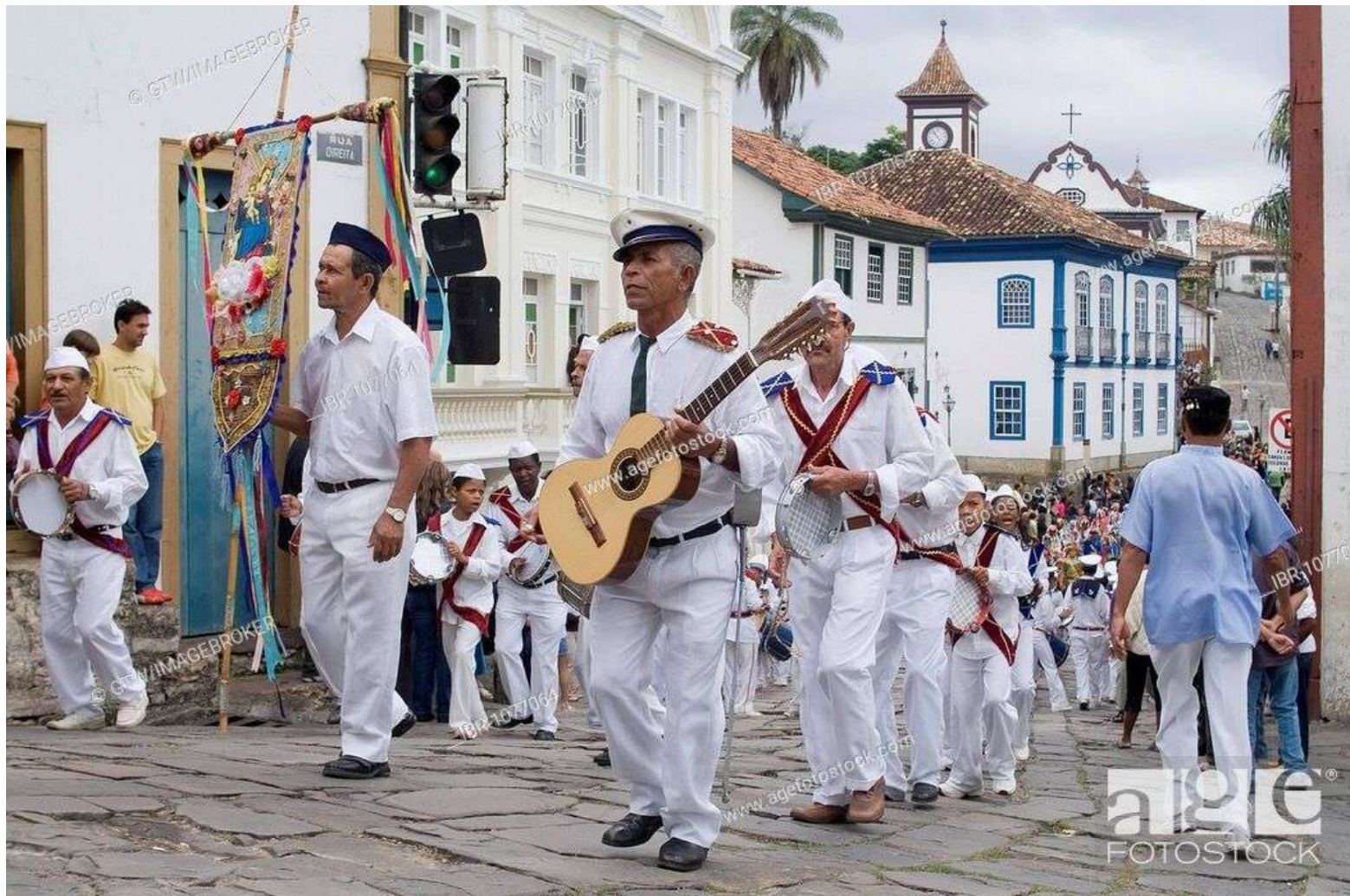
Festa de Nossa Senhora de Rosario à Diamantina