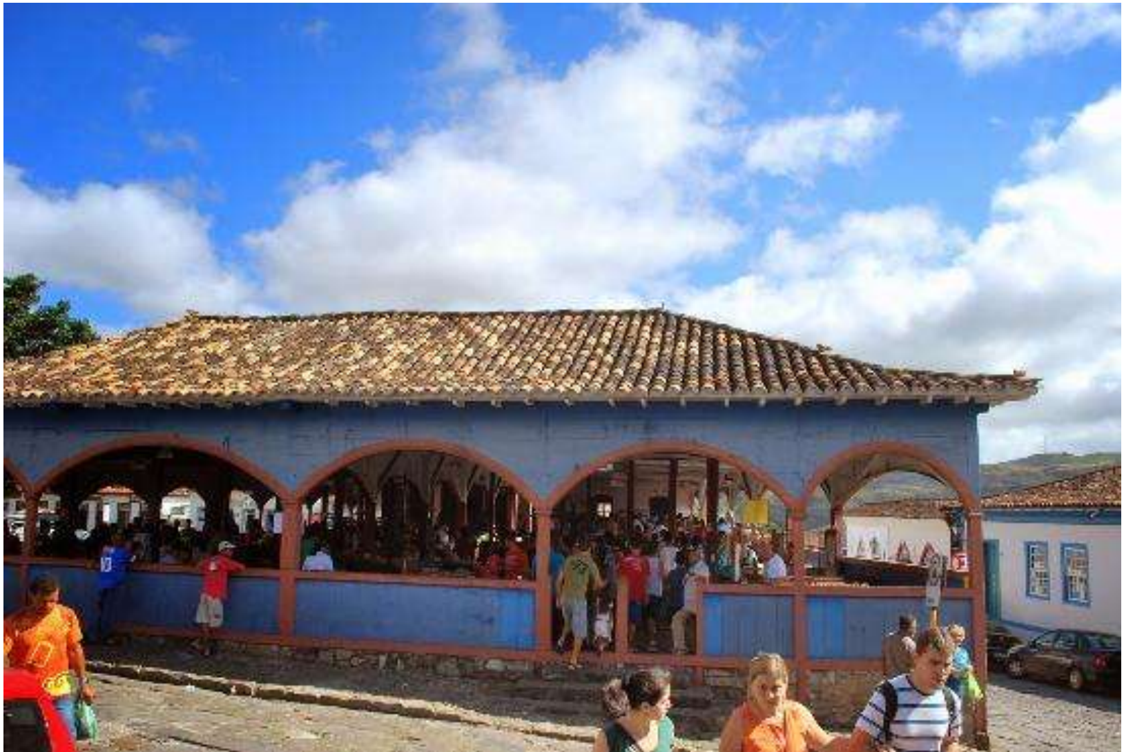
Diamantina, le vieux marché municipal.