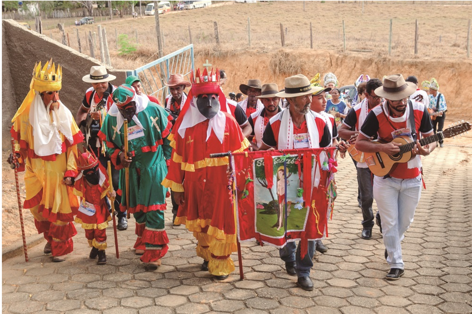
La communauté d'Arturos – groupe quilombola