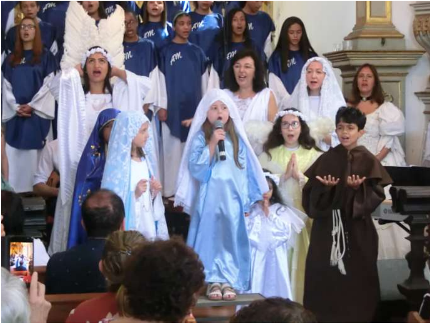
Spectacle religieux célébrant le rosaire, dans l'église de Nossa Senhora do Carmo, à Diamantina. Les enfants personnifient la Vierge et saint François.