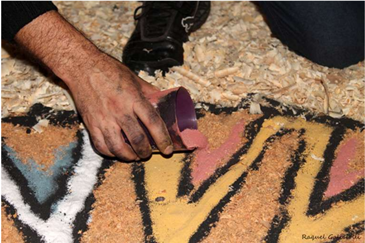
Réalisation des figures en sable coloré et en sciure de bois