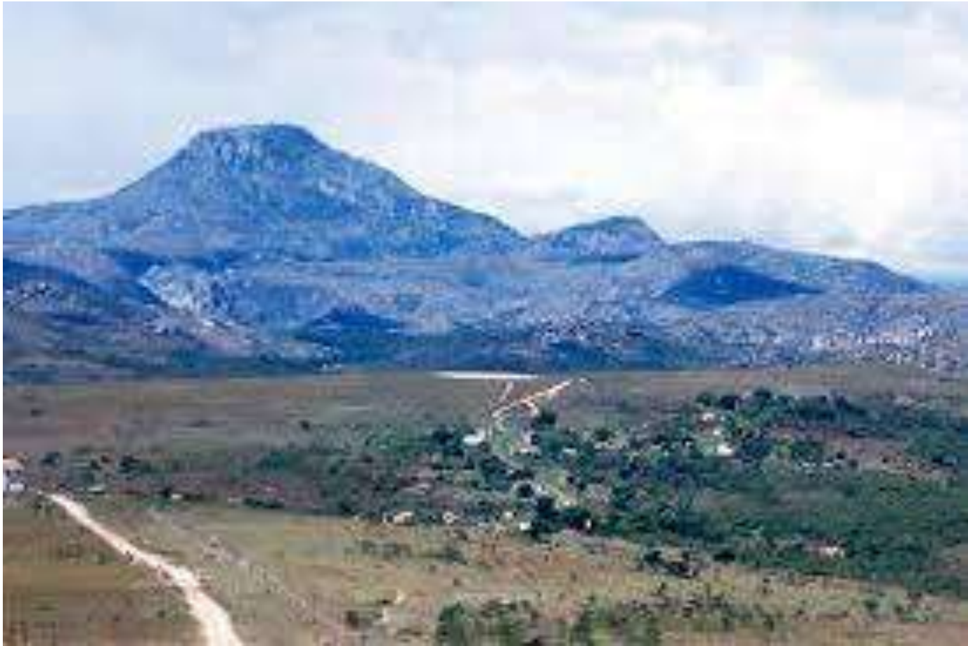
La Serra do Itambé aujourd'hui