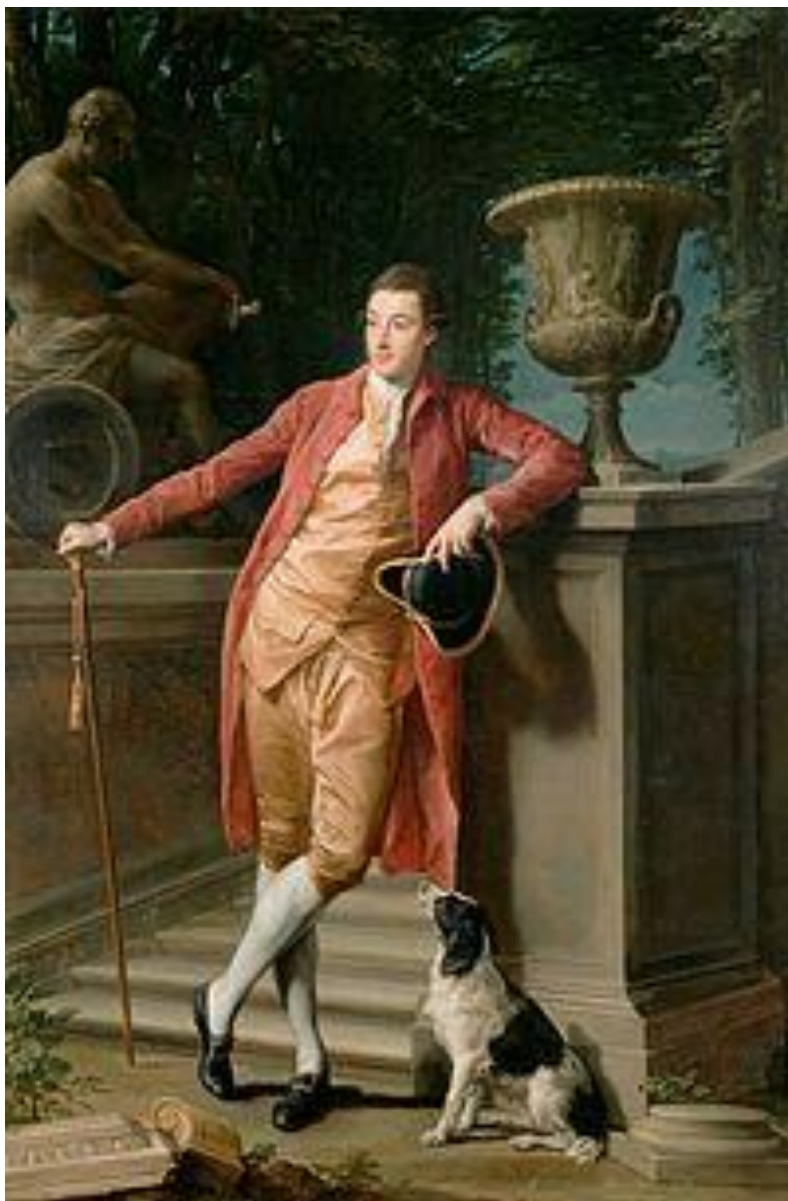
Portrait de John Talbot, futur comte Talbot