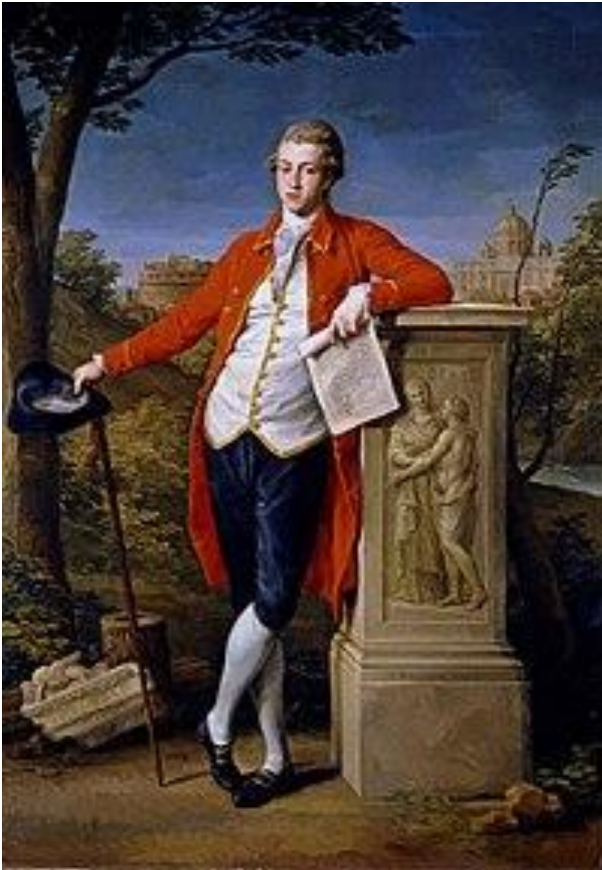
Portrait de Francis Basset, baron de Dunstanville