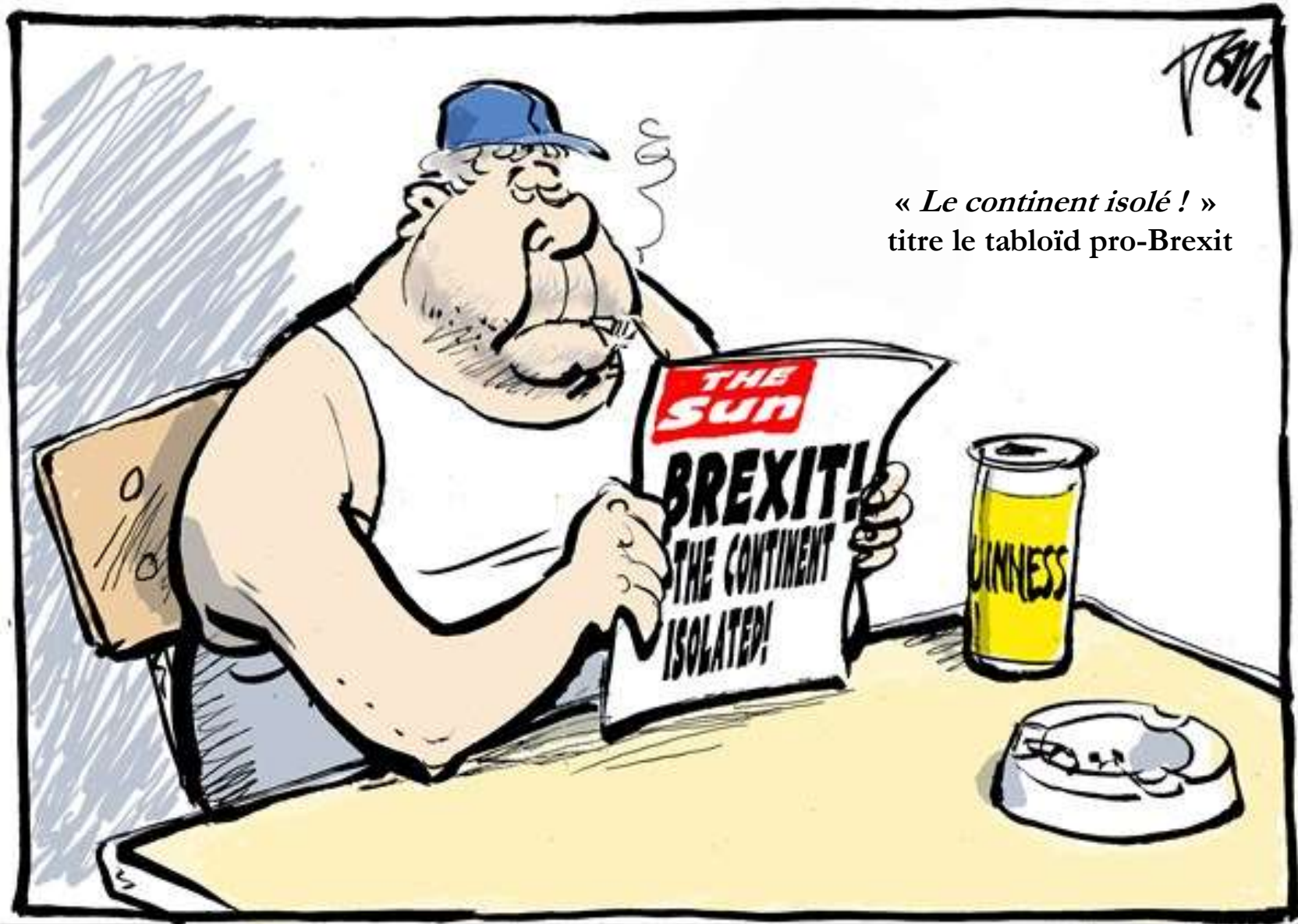
« Le continent isolé ! » titre le tabloïd pro-Brexit