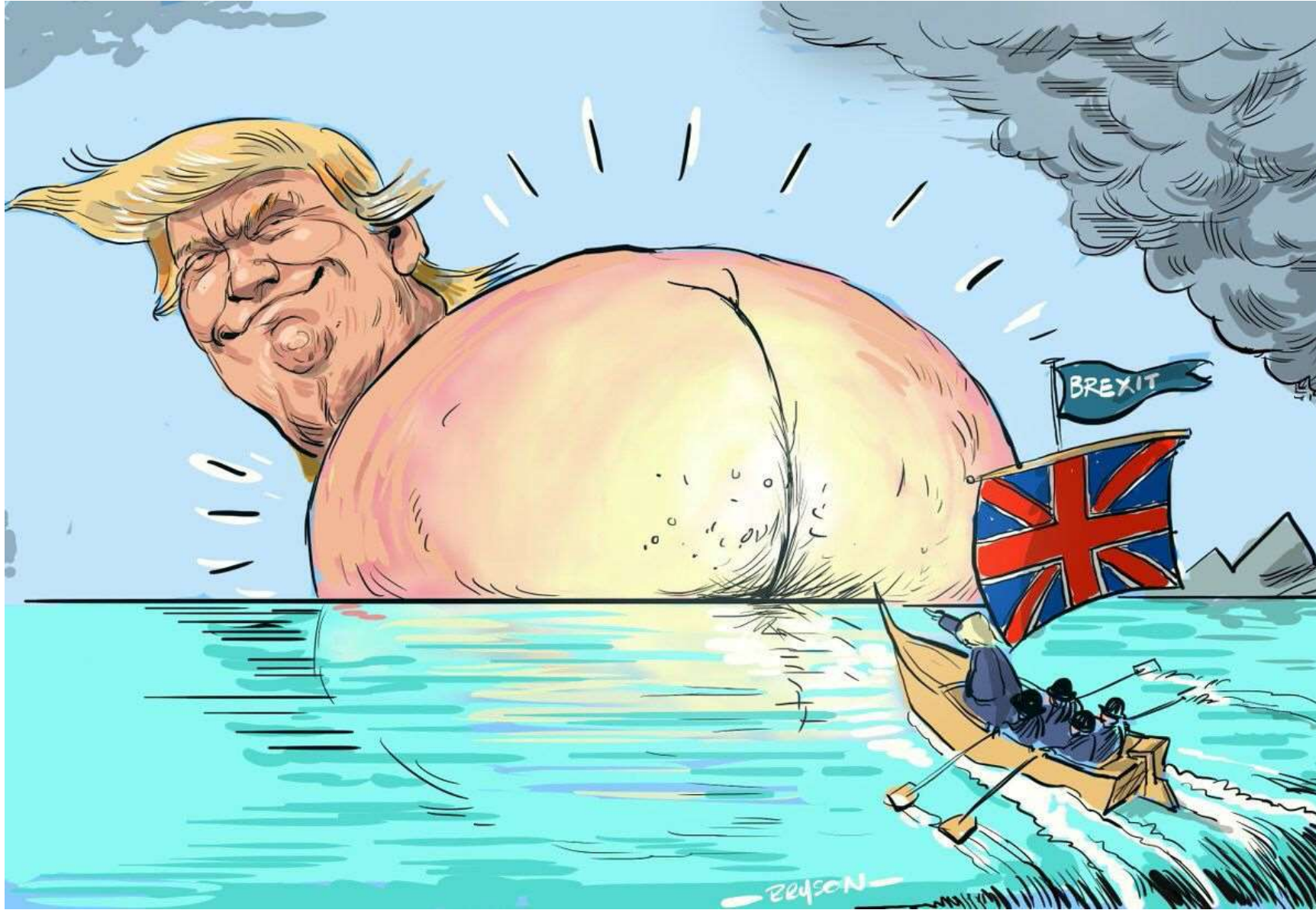
Le trumpisme de l'Amérique