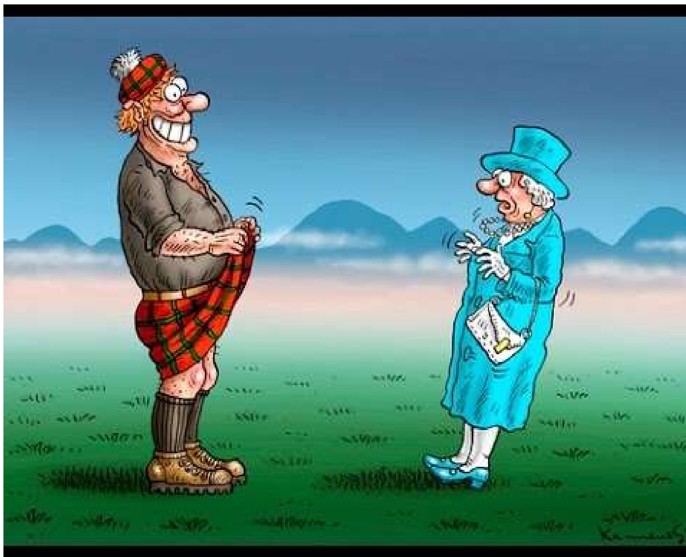
Le « pied de nez » de l' Ecosse au referendum