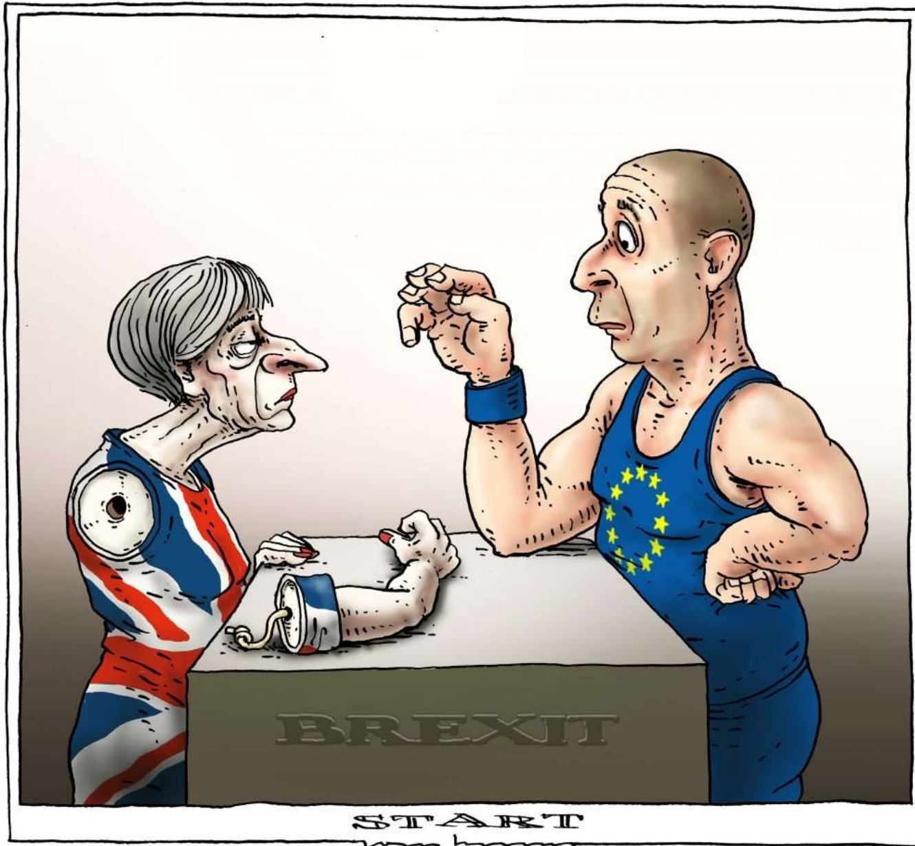
Bras de fer entre Theresa May et l'UE