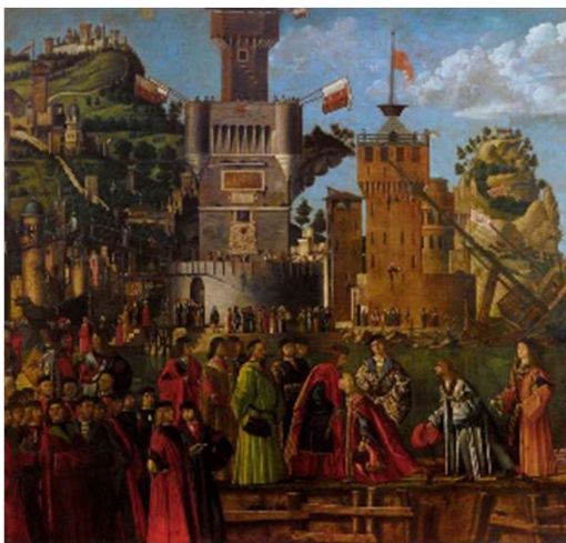
Adieux du prince à ses parents