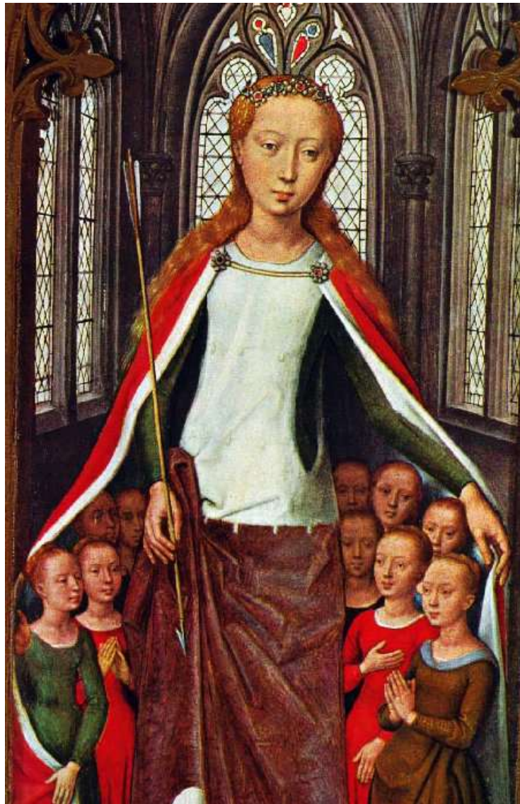
Sainte Ursule protégeant ses 10 compagnes