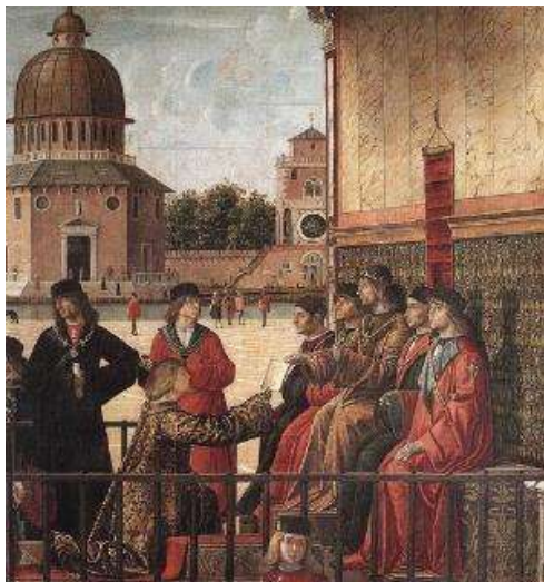
Retour à la cour des ambassadeurs Anglais donnant la réponse de Maurus.