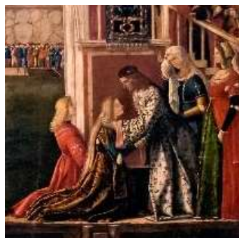
Rencontre du prince avec la princesse