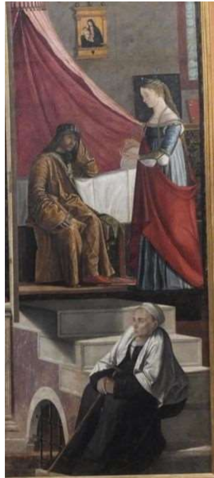
Sainte Ursule posant ses conditions à son père. Au bas de l'escalier sa nourrice attend.