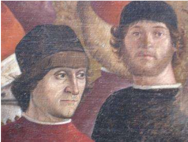
Vittorio Carpaccio (à droite) 1465-1525

Voici deux représentations très différentes de la légende, l'une de V. Carpaccio sur de grandes toiles réunies dans une salle du musée de l'Académie à Venise, l'autre de H. Memling sur des miniatures décorant la châsse de Sainte Ursule à Bruges.