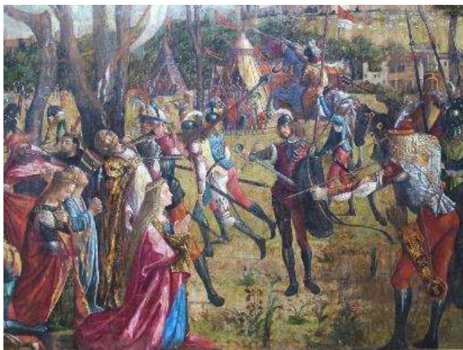
Sainte Ursule assassinée par le prince