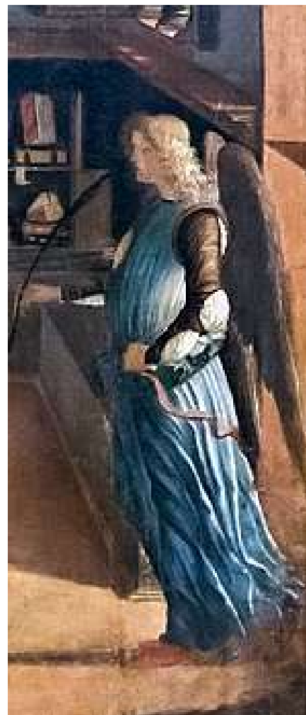
L'ange avec la palme du martyre