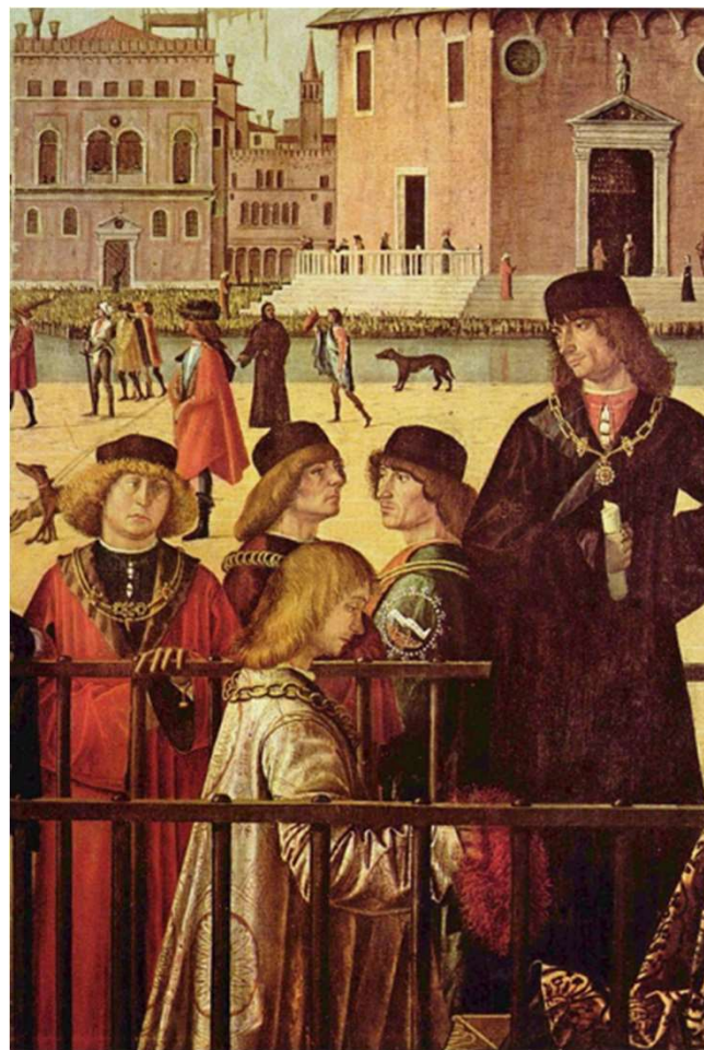
La cour de Bretagne est très vénitienne !