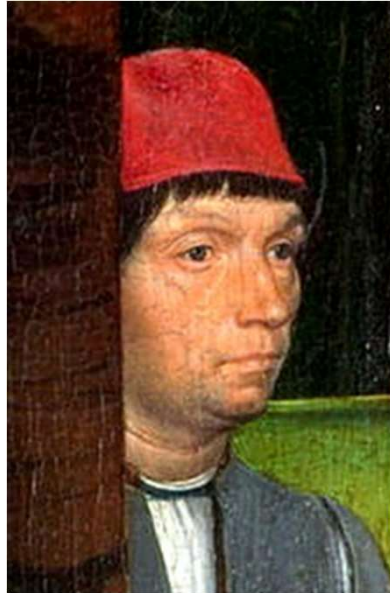
Hans Memling 1435-1494

La légende de Sainte Ursule est racontée par J de Voragine dans la légende dorée.