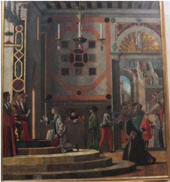
Le roi Maurus remet aux ambassadeurs la réponse pour le roi d'Angleterre