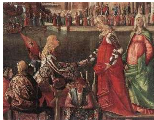
Rencontre du prince avec la princesse