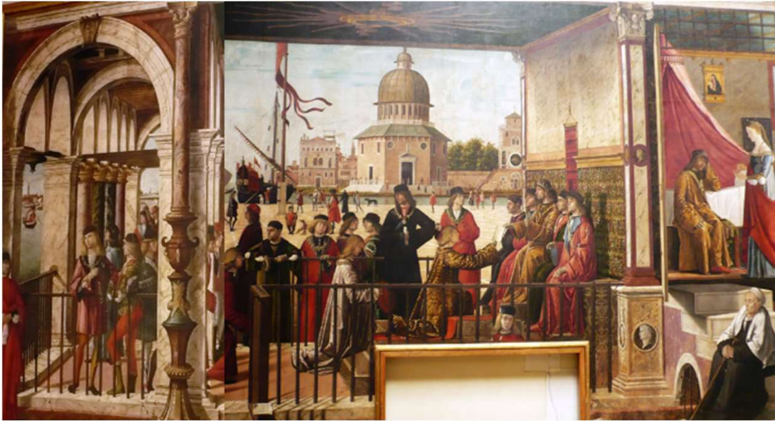
1 er Tableau « L'arrivée des ambassadeurs anglais » pour demander la main d'Ursule à son père, roi de Bretagne.