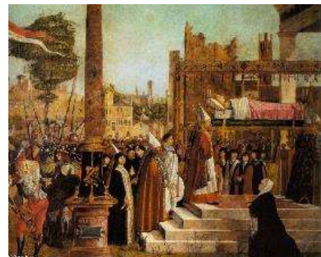
Sainte Ursule veillée par les évêques en bas des marches sa nourrice