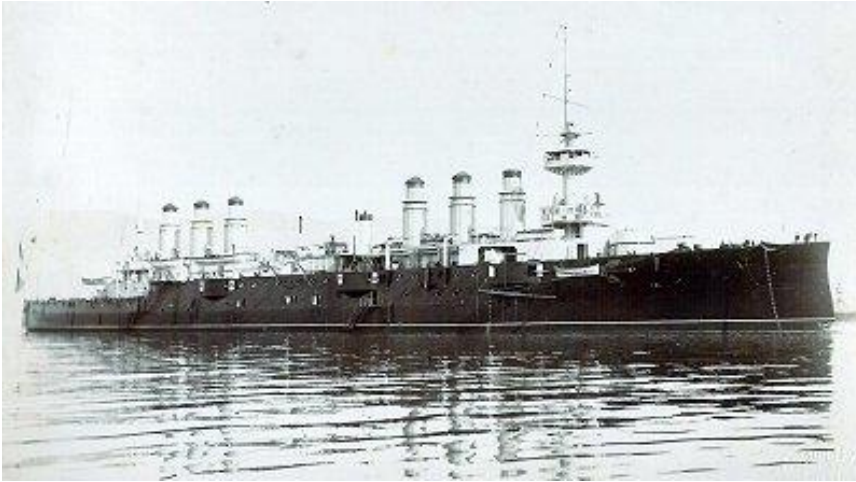
Figure 4 - Le croiseur cuirassé Jeanne d'Arc

au 15 février 1933, son retrait du service, la longévité de ce bâtiment reste exceptionnelle.