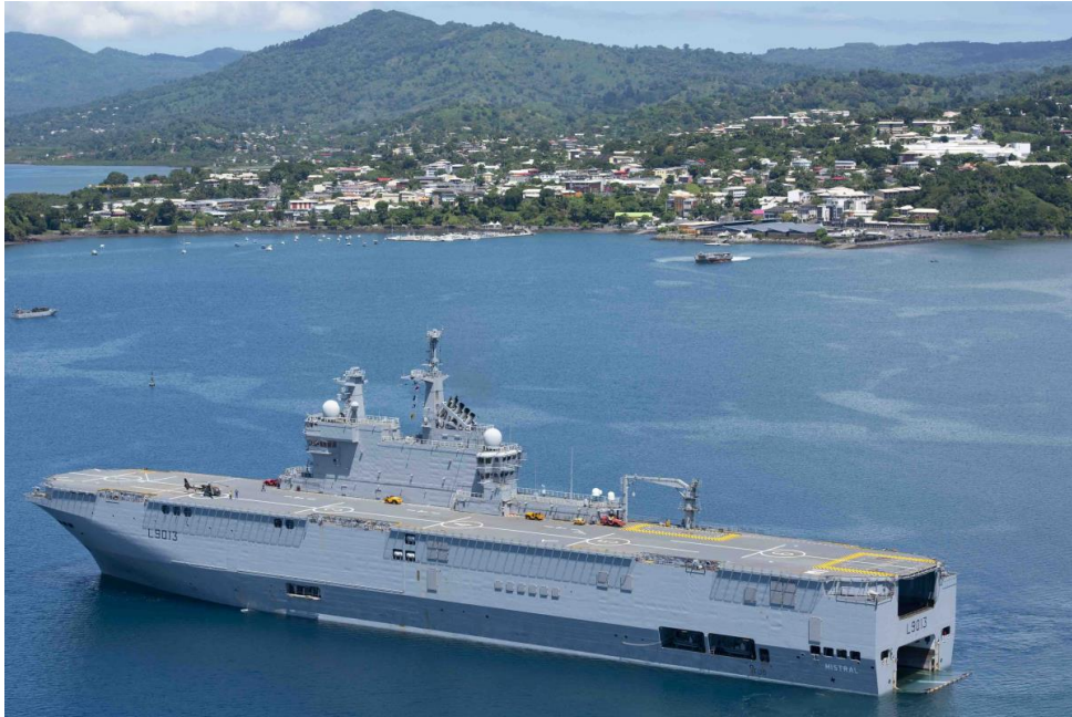
Figure 12 - Porte-hélicoptères amphibie (PHA) Mistral