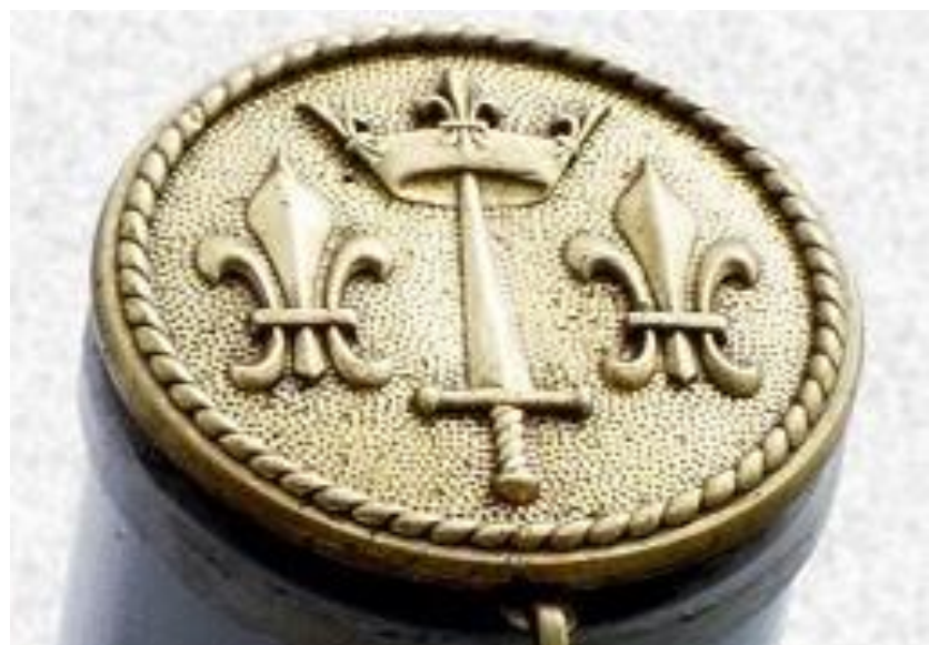
Figure 8 - Tappe de bouche d'un canon de 100 mm du PH Jeanne d'Arc