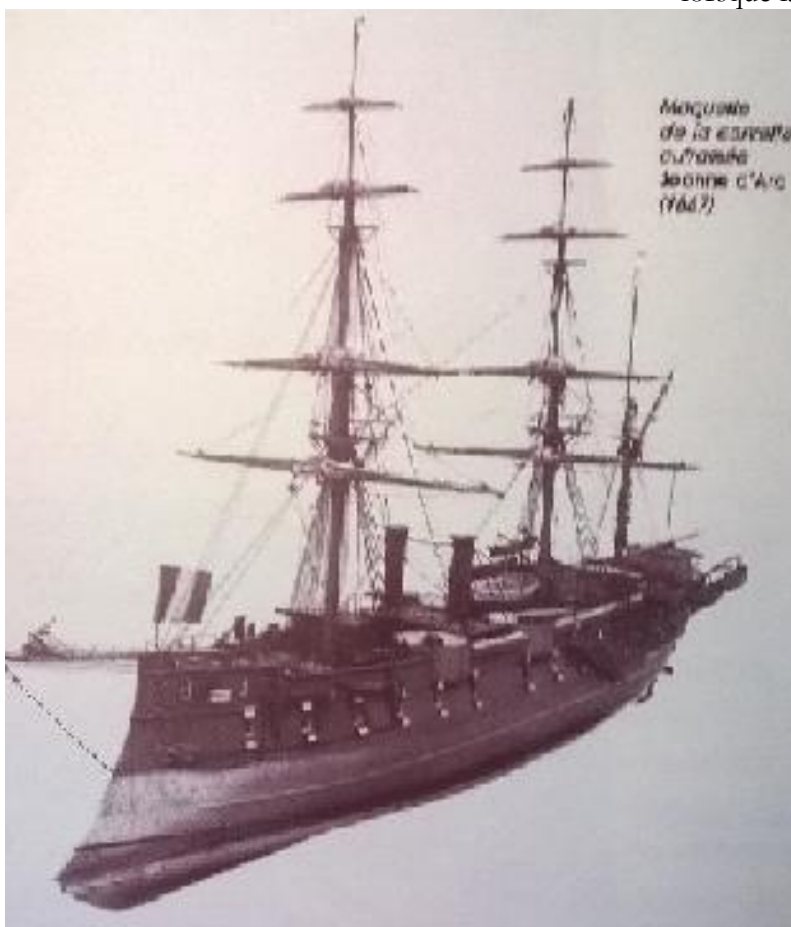
Figure 3 - Maquette de la corvette cuirassée Jeanne d'Arc

En 1912, la Jeanne d'arc remplaça le Duguay-Trouin comme navire école d'application. Elle avait accompli deux campagnes de formation lorsque la guerre de 14-18 éclata.