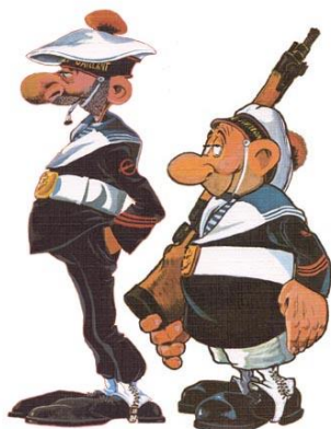
Figure 1 - Alors prêts pour monter à bord ?