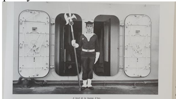
Figure 10 - Au poste de garde, en attente de l'Amiral