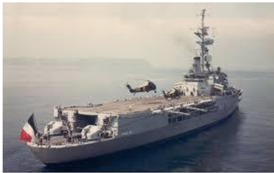
Figure 7 - Le porte-hélicoptères Jeanne d'Arc