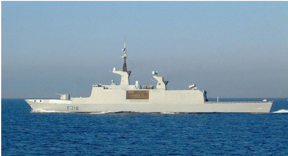
Figure 13 - Frégate (FLF) Guépratte