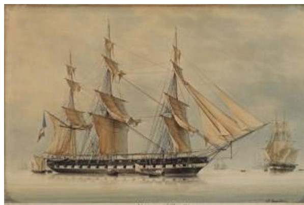
Figure 2 - Cette aquarelle représente l'Artémise, une frégate de 52 canons, comparable à la Jeanne d'Arc, construite en 1830.

Rayée des listes de la flotte le 26 octobre 1833, elle est alors réutilisée comme bâtiment de servitude, avant d'être définitivement condamnée en 1834.