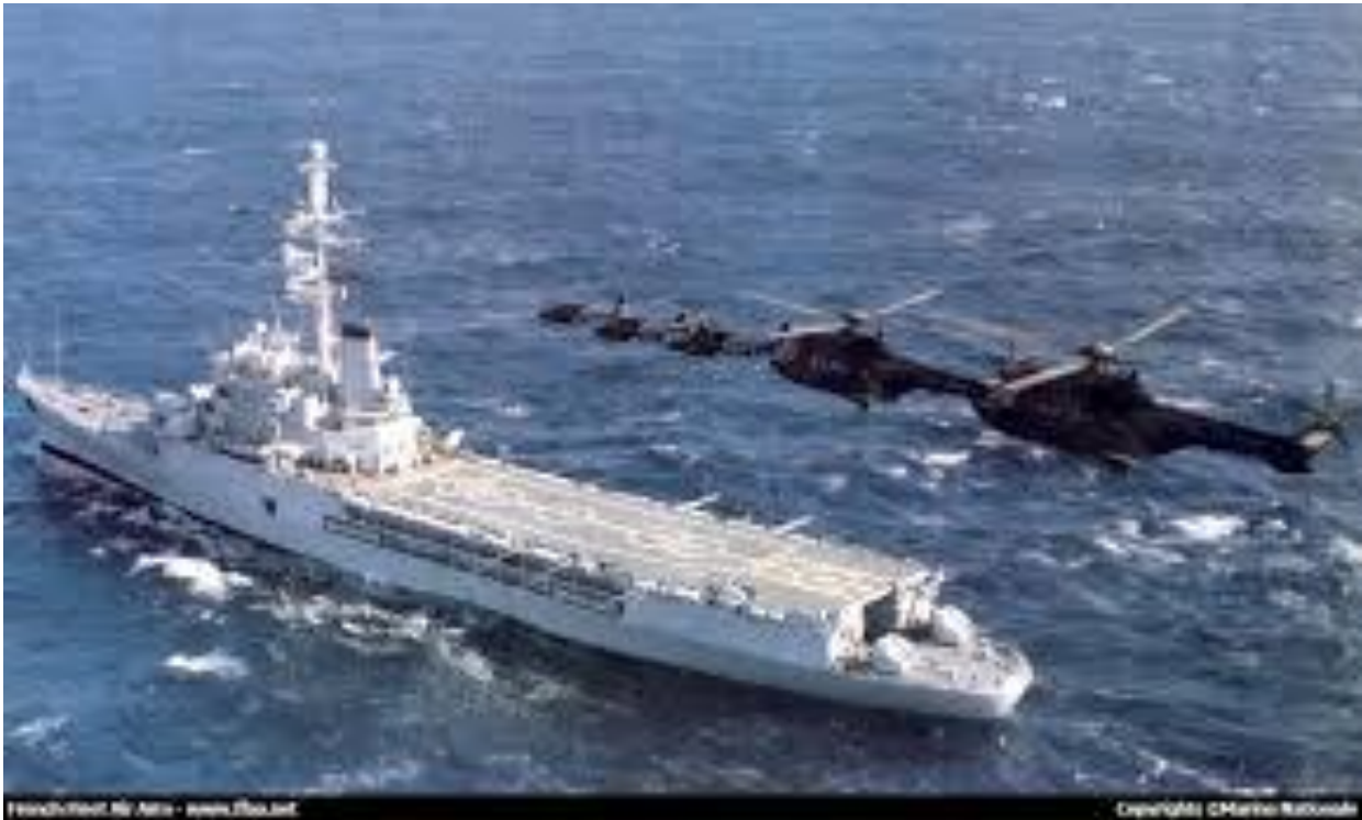
Figure 9 - Le porte-hélicoptères Jeanne d'Arc au cours d'un exercice