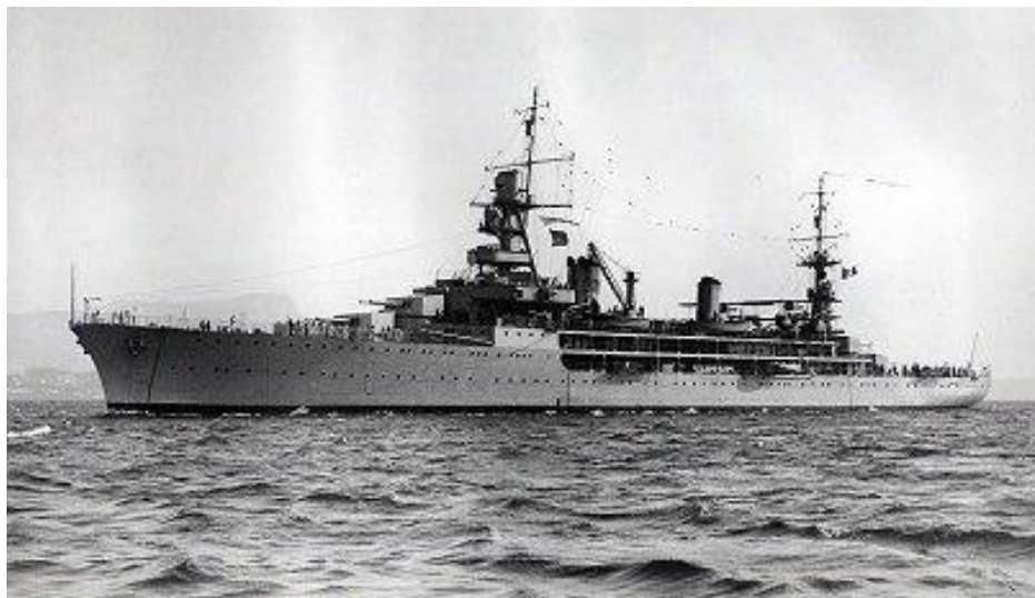
Figure 6 - Croiseur école Jeanne d'Arc (1931-1964)

Au début de la guerre 1939-1940, le bâtiment fut affecté à la Division navale d'Atlantique-Ouest et participa au blocus des bâtiments de commerce allemands réfugiés dans les ports neutres. En juin 1940, il se trouvait aux Antilles où il resta jusqu'en juillet 1943. En septembre de la même année, il prit part aux opérations de Corse, puis au débarquement de Provence, le 15 août 1944. La Jeanne d'Arc fut citée à l'ordre de l'Armée pour les services rendus pendant les hostilités. Elle assura ensuite son rôle de croiseur-école jusqu'en 1964, accomplissant 27 campagnes autour du monde.