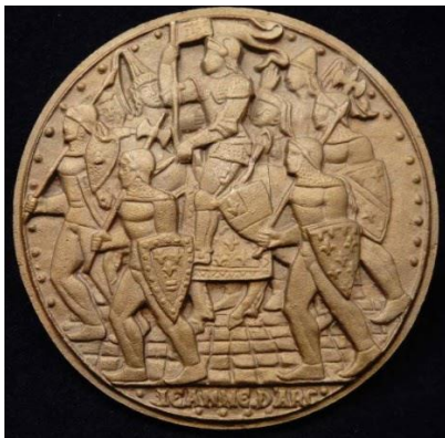
Figure 14 - Tape de bouche : Jeanne d'Arc et ses compagnons